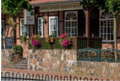
Hotel Acht Linden